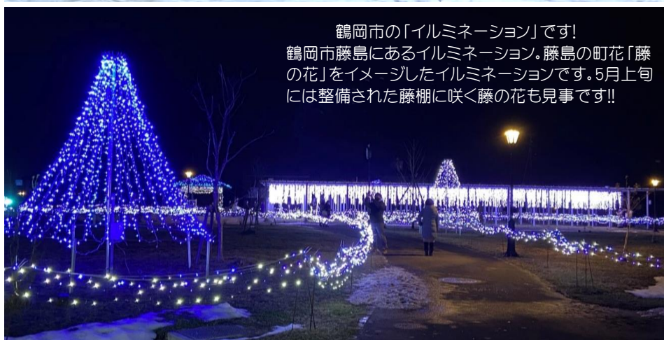
鶴岡市の「イルミネーション」です! 鶴岡市藤島にあるイルミネーション。藤島の町花「藤の花」をイメージしたイルミネーションです。5月上旬には整備された藤棚に咲く藤の花も見事です!!