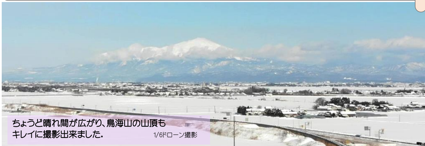
ちょうど晴れ間が広がり、鳥海山の山頂もキレイに撮影出来ました。 1/6ドローン撮影

明けましておめでとうございます。本年もどうぞ宜しくお願い致します。 コロナ禍の為、いつもの年とは違う静かな年明けとなりました。年明け早々に寒波が訪れ、自宅、会社作業場前、事務所前の除雪の作業に始まりました。12/31~年末休暇、1/6~仕事始めで全従業員5名、欠席者なく出社されました。今年も皆様に少しずつ会社内や、従業員情報をこのチラシでお知らせさせて頂きながらお伝えしていきたいと思ひます。どうぞご期待下さい!!