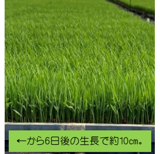
←から6日後の生長で約10cm。