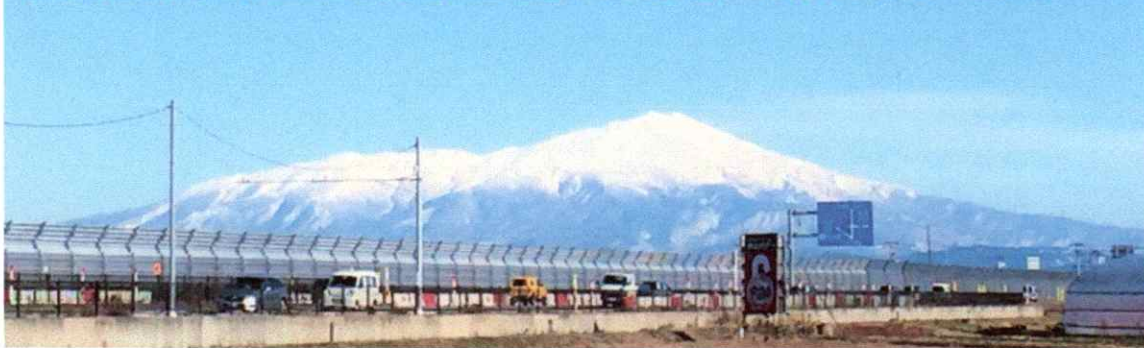
R1, 11/29、一面の銀世界になった日はこの冬期間、この日だけです

この冬期間、例年になく降雪量が見事に少ない日が続いています。東北ならではの降雪や気温の変化が田んぼの土壌の生成が問われる事もあり、とても不安な日々が続いています。 12/9撮影