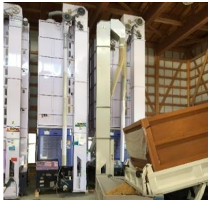
③ 投入された籾は自動で乾燥機へ運ばれるように設定されています。