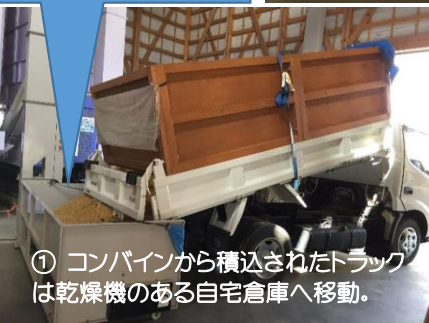
① コンバインから積込されたトラックは乾燥機のある自宅倉庫へ移動。

⑤ →右の写真は水分調整を終えた籾約1トン弱のフレコンバッグです。農協へ出荷予定のものとなります。