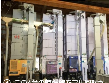
④ この4台の乾燥機をフル回転させ水分の調整を行います。