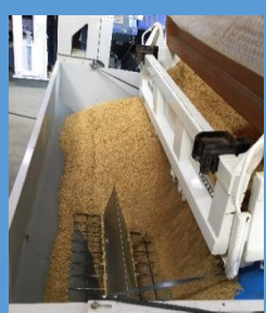
② トラックで運ばれた籾を乾燥機へ投入!!